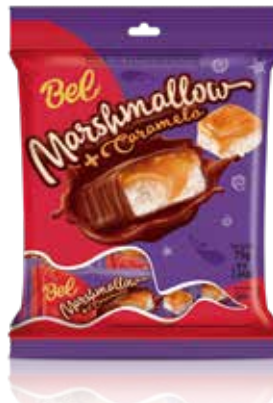
BOMBOM MARSH C/ CARAMELO 24X75G