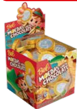
MOEDAS SABOR CHOCOLATE 12X370G