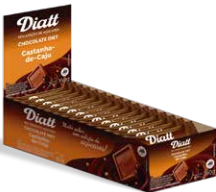
DIATT TABLETE CASTANHA 10G