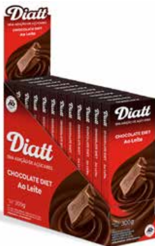
DIATT DISPLAY TABLETE AO LEITE