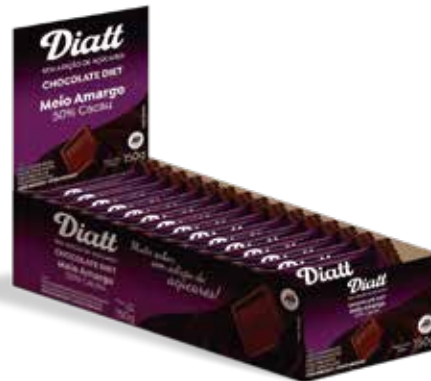
DIATT TABLETE MEIO AMARGO 10G