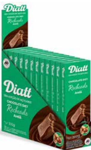
DIATT TAB RECH. AO LEITE AVELÃ 25G