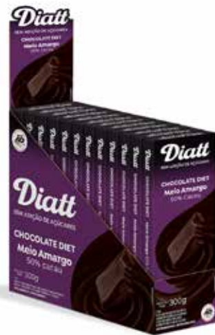
DIATT DISPLAY TABLETE MEIO AMARGO