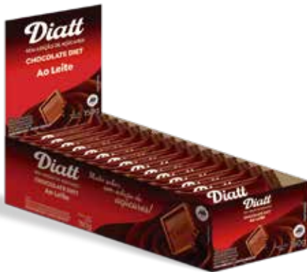
DIATT TABLETE AO LETE 10G