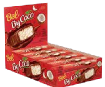
BEL BY COCO 8X18X25G