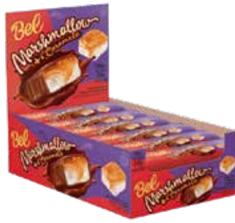
BEL MARSH C/ CARAMELO 8X18X30G