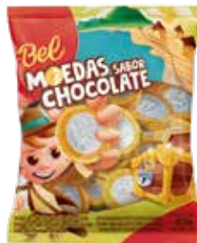
MOEDAS SABOR CHOCOLATE 25X40G