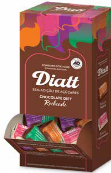
DIATT BOMBOM MISTO DIET EXPOSIÇÃO