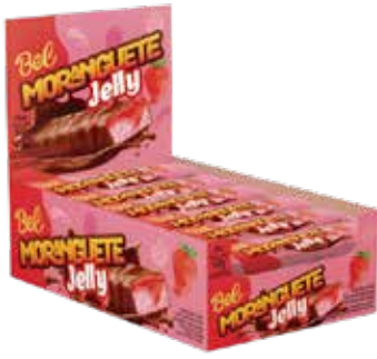
MORANGUETE JELLY 8X18X30G