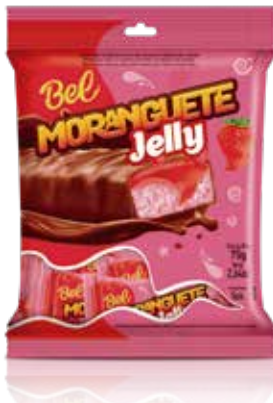
BOMBOM MORANGUETE JELLY 24X75G