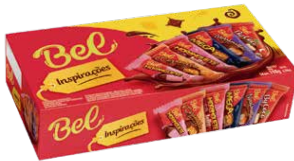
BOMBOM BEL INSPIRAÇÕES 30X198G