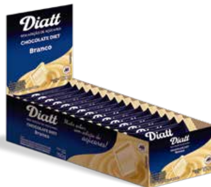
DIATT TABLETE BRANCO 10G