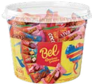
BOMBONS SORTIDOS 9G POTE 450G