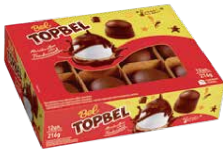
TOP BEL'S TRAD. AO LEITE 16X12UN.