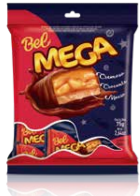
BOMBOM BEL MEGA 24X75G