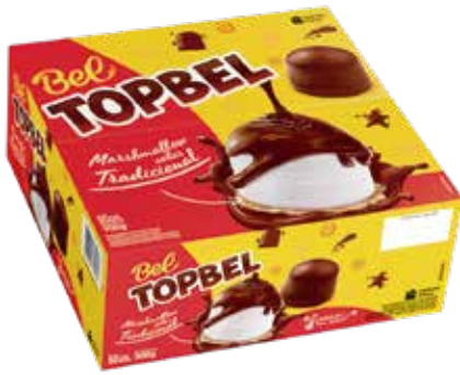
TOP BEL'S TRAD. AO LEITE 50UN.