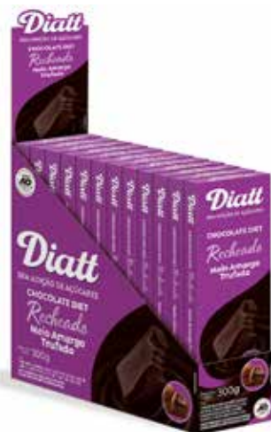
DIATT TAB RECH. MEIO AMARGO TRUFA 25G