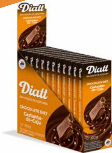
DIATT DISPLAY TABLETE CASTANHA