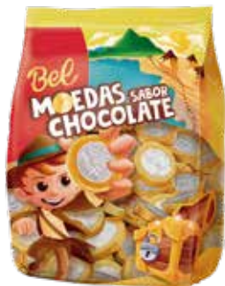
MOEDAS SABOR CHOCOLATE 16X500G