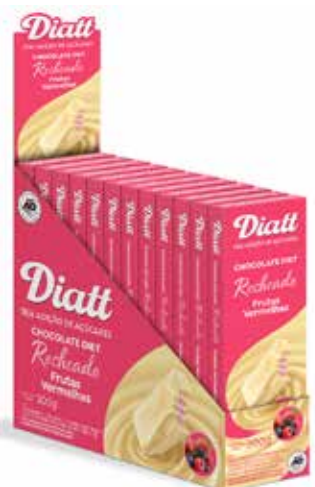
DIATT TAB RECH. BRANCO FRUTAS VERM. 25G