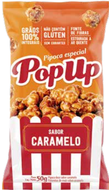
POP UP CARAMELO 36X50G