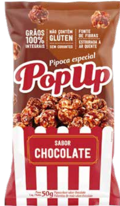
POP UP CHOCOLATE 36X50G