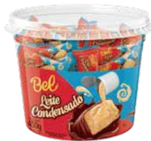
BOMBOM LEITE COND. 9G POTE 450G