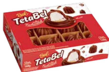
TETA BEL TRAD. AO LEITE 16X12UN.