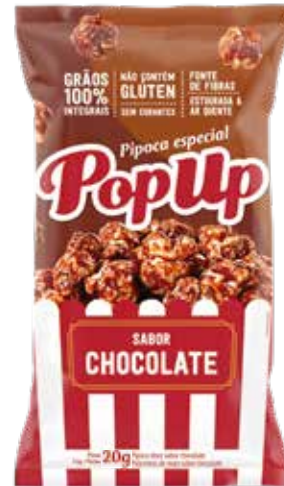
POP UP CHOCOLATE 51X20G