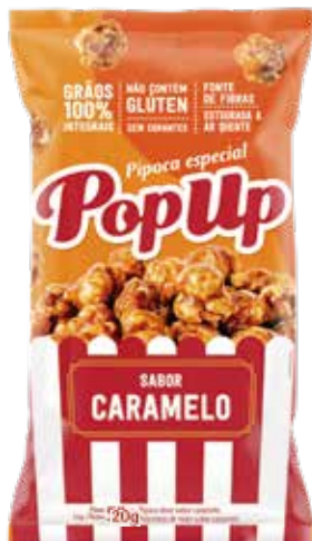
POP UP CARAMELO 51X20G