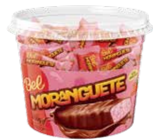
BOMBOM MORANGUETE 9G POTE 450G