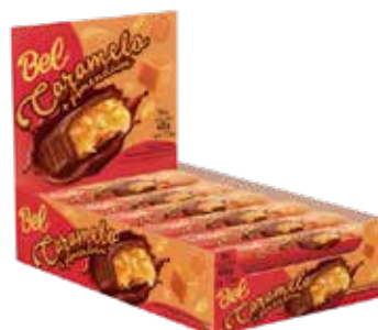
BEL CARAMELO 8X18X27G