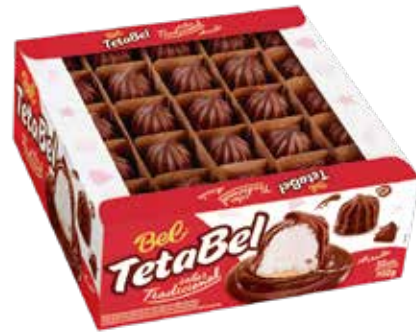
TETA BEL TRAD. AO LEITE 50UN.