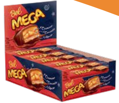
BEL MEGA 8X18X35G