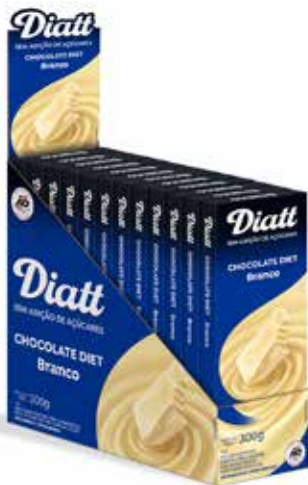
DIATT DISPLAY TABLETE BRANCO