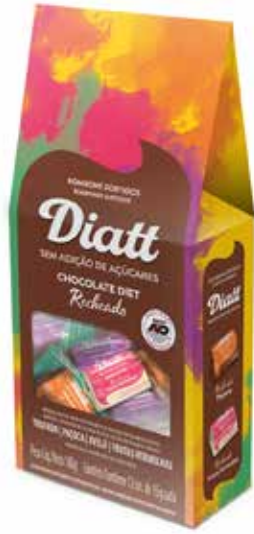
DIATT BOMBOM MISTO DIET 12UN.