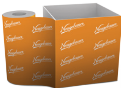
Bobina de Forração